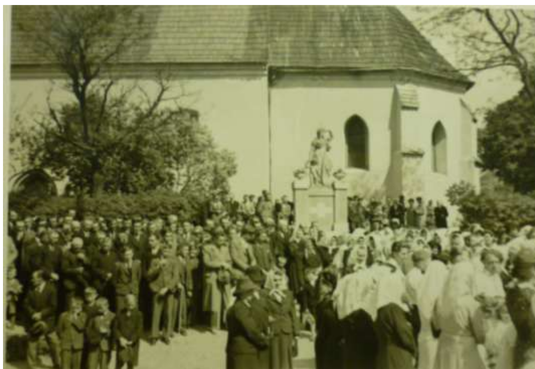
Boží Tělo v Bohdanči, roku 1942, průvod u II. oltáře