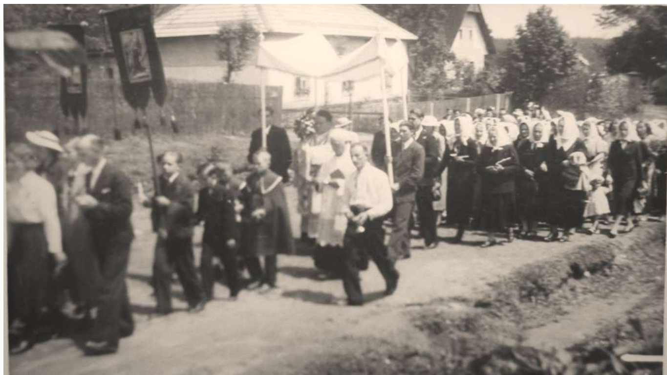
Boží Tělo v Třebětíně