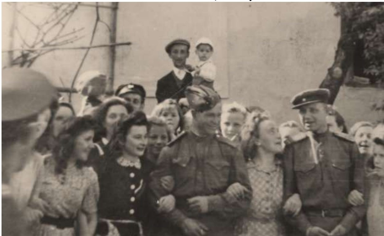
Osvobození v Bohdanči, ruští vojáci

Všechny fotky jsou z Kroniky bohdanečské farnosti.