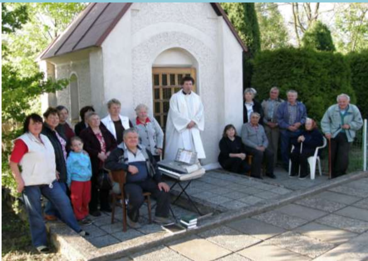
Podvečerní středeční bohoslužba – Májová 15. 5. 2013, v kapličky v Řeplicích