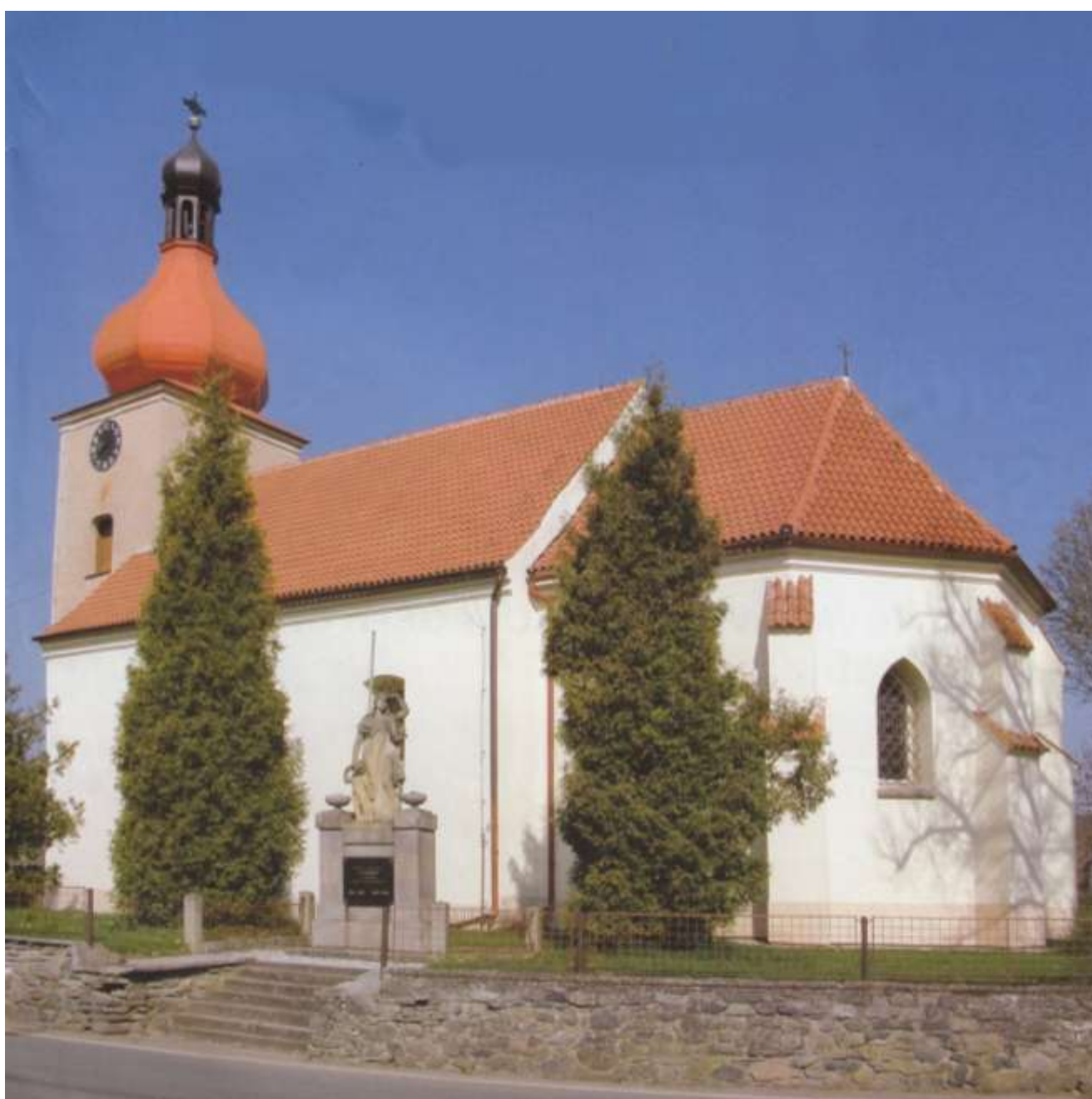
BOHDANEČ – kostel Zvěstování Páně od jihovýchodu