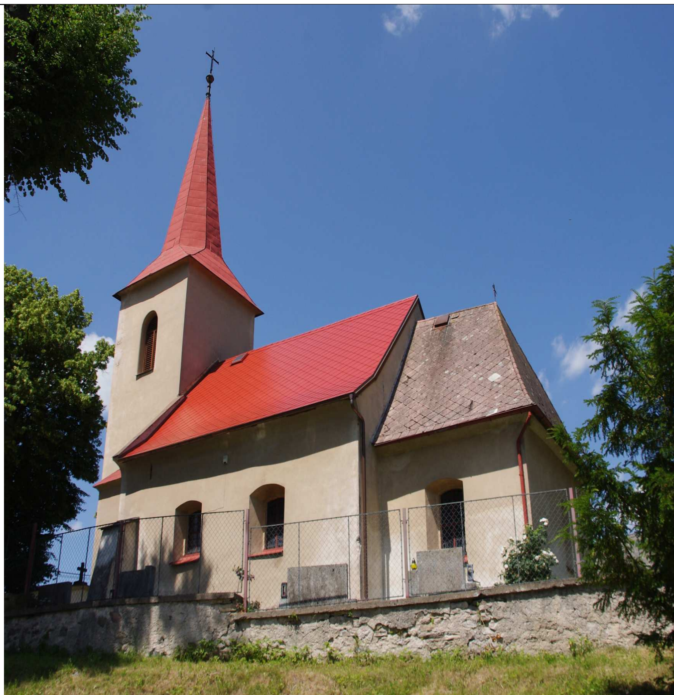
TŘEBĚTÍN – Kostel Navštívení Panny Marie