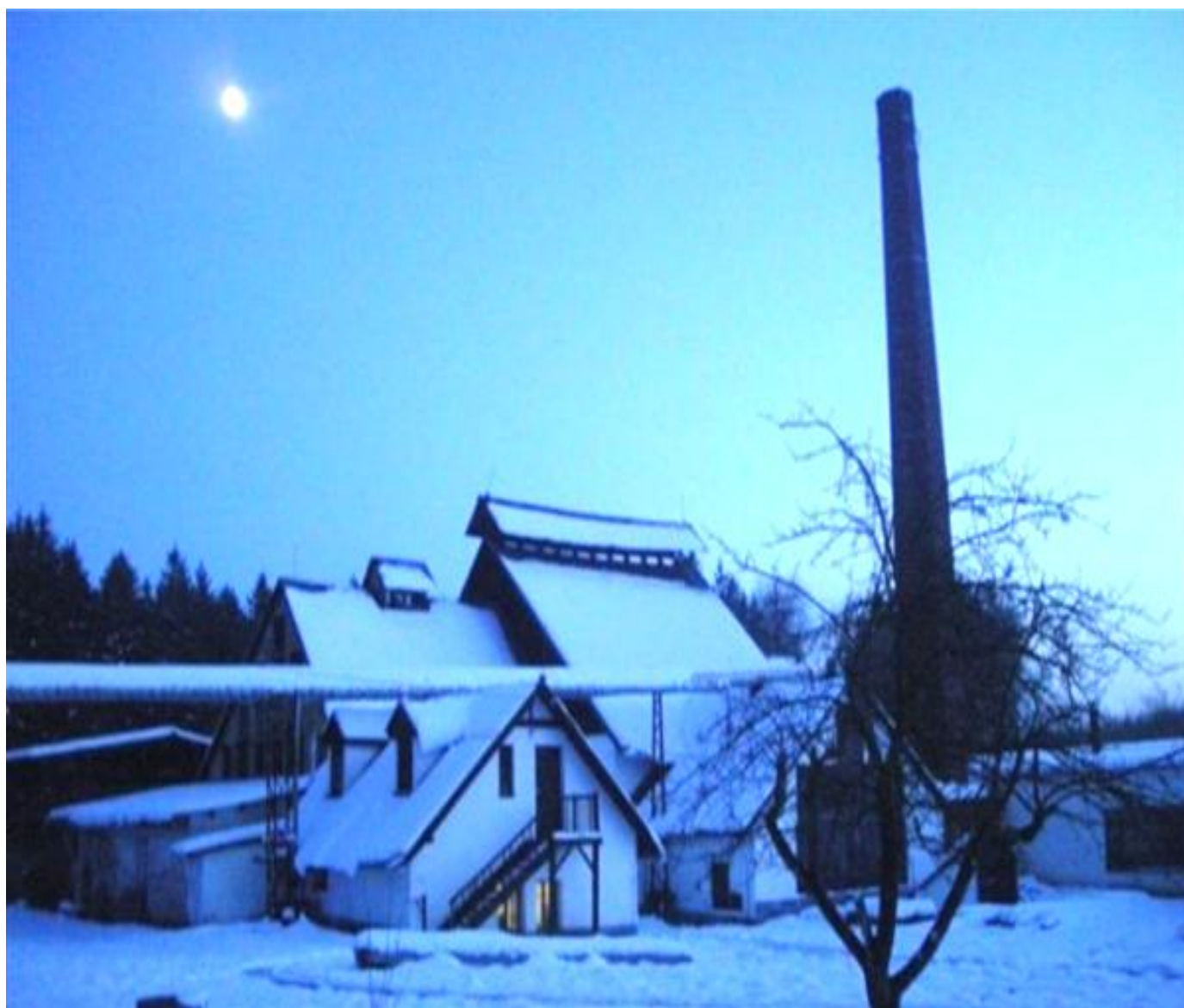
TASICE – sklárna, skanzen z roku 1796