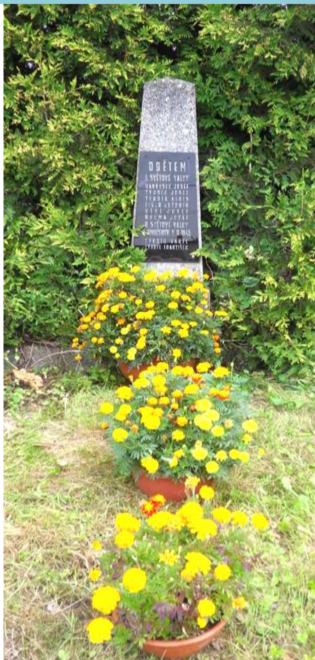
Pomník obětem I. a II. světové války

Kolem vsi je také několik starých, státem chráněných lip, nejstarší z nich, lípa velkolistá, která stojí na konci vsi, při silnici do Bělé, má v obvodu téměř 5 metrů a její stáří se odhaduje na 300 let. Je to asi nejstarší památný, státem chráněný strom v okolí, patřící mezi dědictví kraje. Před asi dvěma lety se přehnala krajem vichřice, která rozlomila téměř půl koruny tohoto stromu, a letos v červnu do ní uhořel při bouři hrom, takže museli zasahovat také hasiči. Lípě, která je dominantou Kotoučova, teď chybí téměř polovina její kdysi košaté koruny, je narušená a bude se zastřešovat, aby do ní nepršelo a nepadalo listí a povětrnostní podmínky ji dále nenarušovaly.