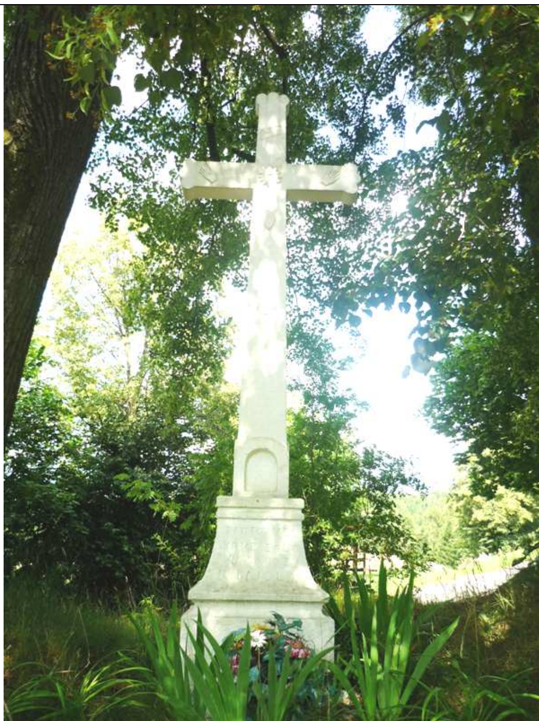
K O T O U Č O V – kamenný kříž z roku 1868