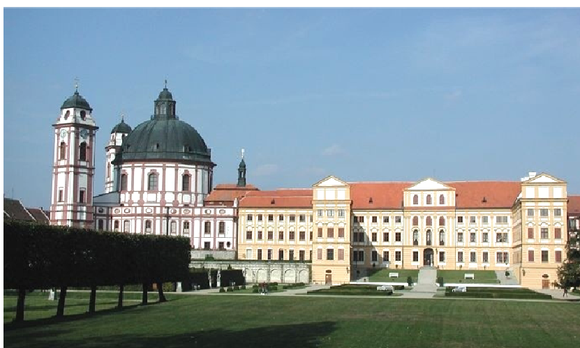
zámek Jaroměřice nad Rokytnou

Poté jsme se odebrali k zámku, kde se nabízely dvě prohlídkové trasy, dále bylo možné zajít do francouzského parku, anglický byl uzavřen z důvodu večerního koncertu a ohňostroje v rámci konání Mezinárodního hudebního festivalu Petera Dvorského.