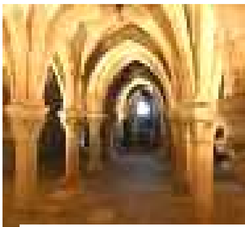
Bazilika sv. Prokopa, krypta