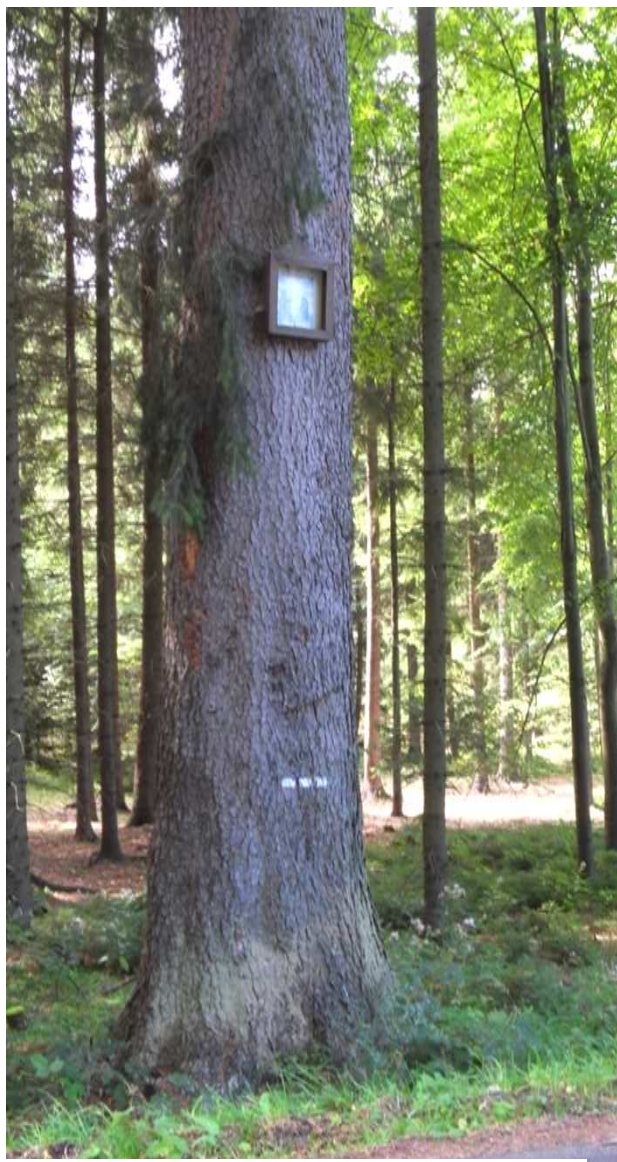
rozcestí U obrázku

Dalším místem, patřícím do naší farnosti, o kterém jsme ještě nepsali, je Kotoučov. Obec se rozkládá na kopci, při silnici z Bohdanče do Bělé, v nadmořské výšce 503 metrů. Poprvé se připomíná v deskách zemských roku 1525 a 1543, „ při tvrzi