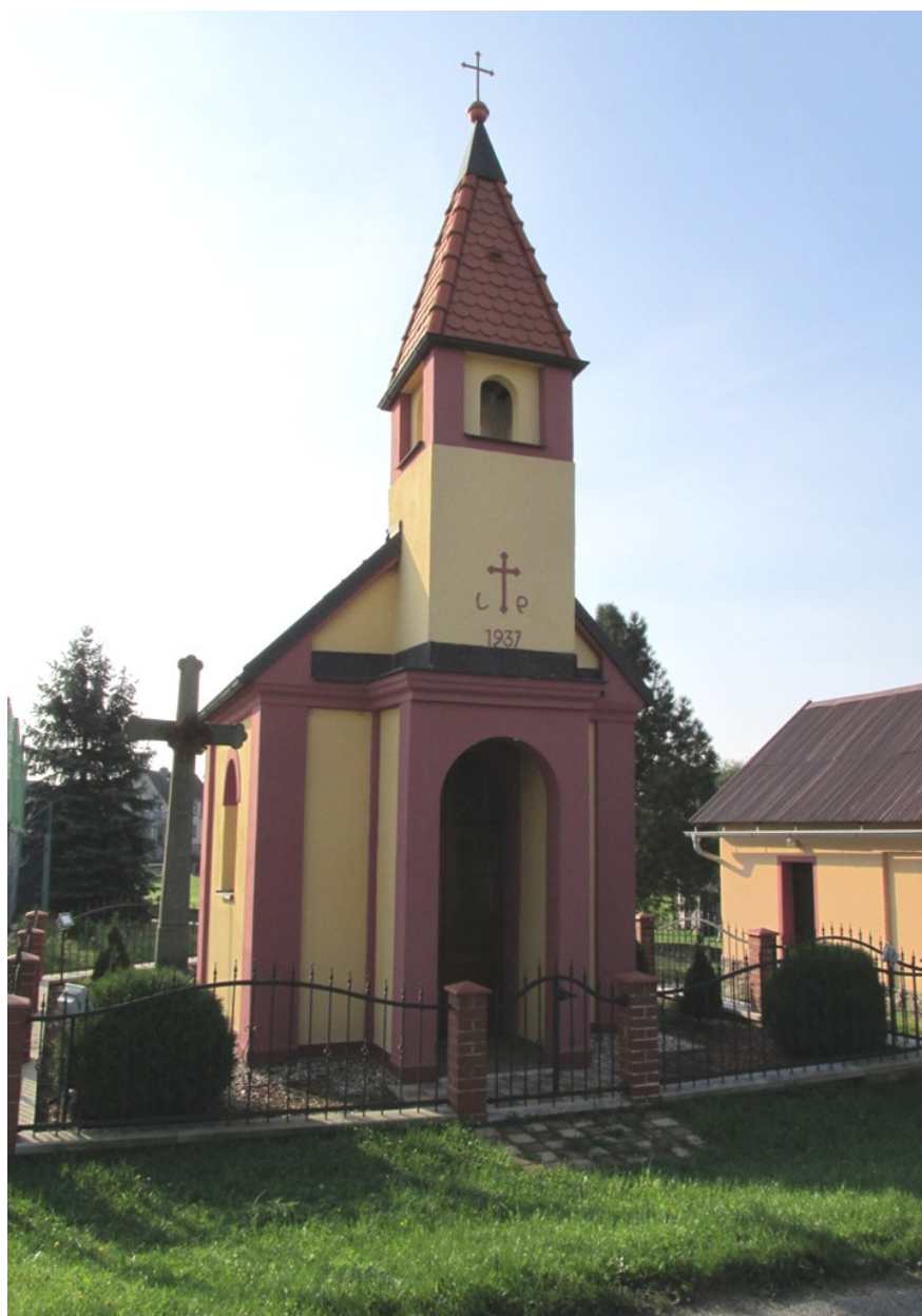
B Ě L Á – kaple svatého Jana Nepomuckého