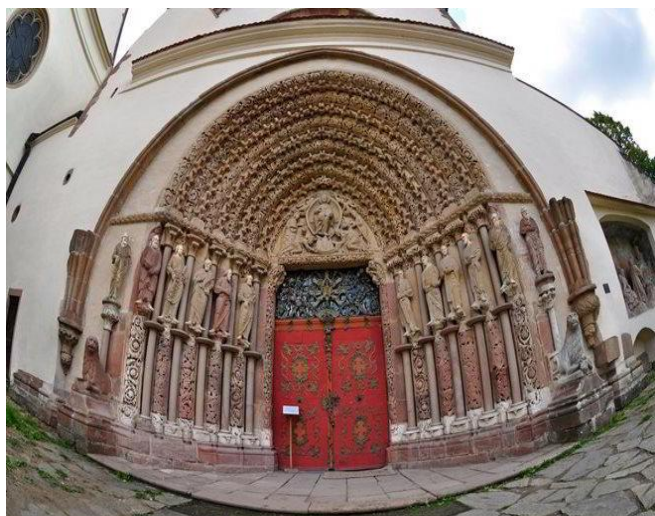
vchod do kláštera Tišnov, s bohatou románsko-gotickou výzdobou

Letošní březnový výlet jsme si naplánovali již loni v srpnu, na výletě v Broumově, nalákala nás sbírka kamelií v zámku Rájec – Jestřebí u Blanska. K tomu jsme si přidali klášter v Tišnově a zámek Lysice a v neděli, 5. března ráno, jsme se vydali do kraje Moravského krasu. Do Tišnova jsme přijeli před půl desátou ráno, prošli si krátce areál a v 10. hodin začala, v zaplněném kostele, bohoslužba první postní neděle. Ikdyž je chrám Nanebevzetí Panny Marie velmi starý, jeho historie sahá