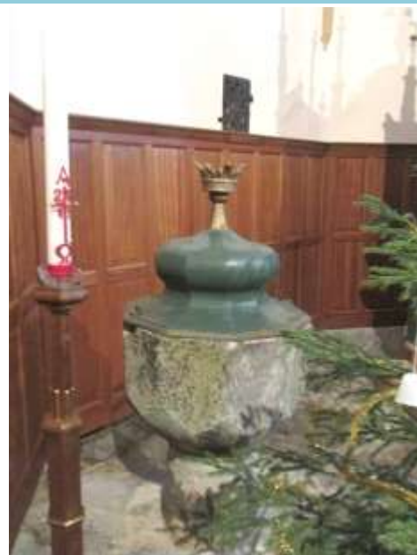
křtelnice v Bohdanči