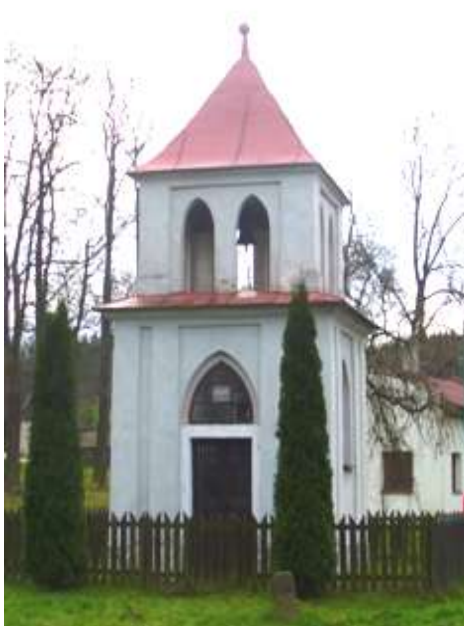
VICKOVICE – kaplička Nejsvětější Trojice